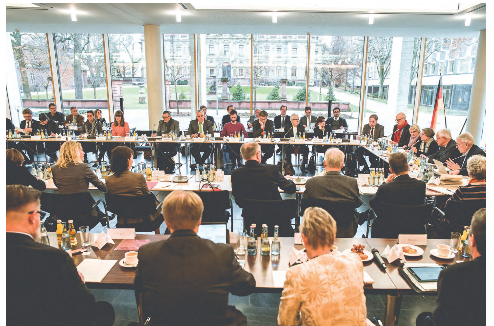
06.12.2018: Gestaltungs-Symposium im Bundesgerichtshof