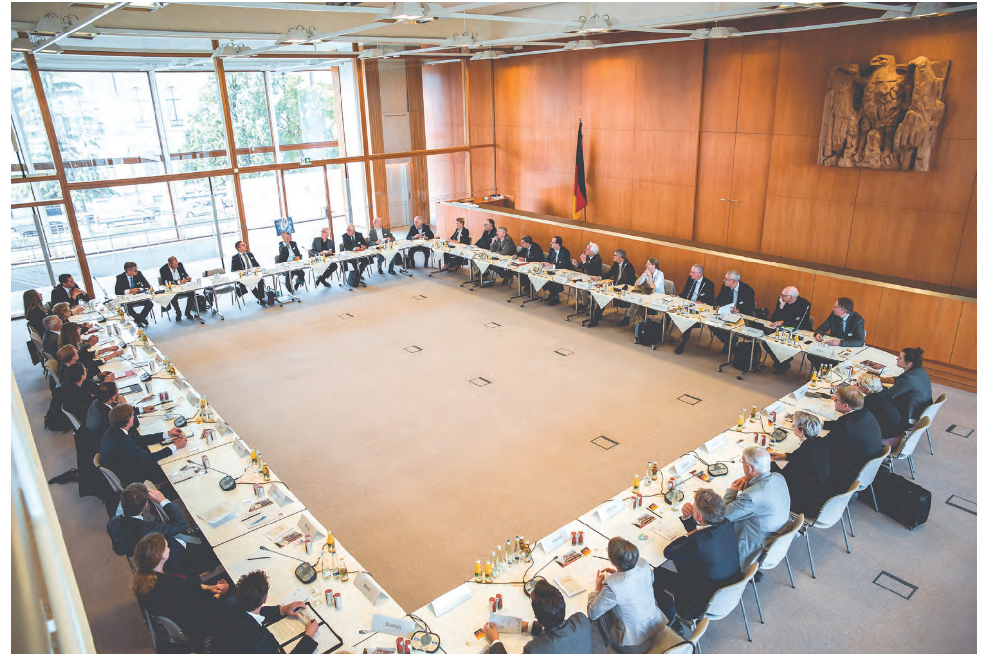
06.09.2018: Inhalts-Symposium im Bundesverfassungsgericht

Die aus Bundesmitteln gespeiste und durch Gesetz errichtete „Stiftung FORUM RECHT“ wird das inhaltliche und bauliche Konzept sowie dessen Umsetzung in Karlsruhe und Leipzig betreiben und dabei von zahlreichen Vertreterinnen und Vertretern verschiedenster Fachrichtungen aus Wissenschaft, Politik und Praxis im Kuratorium und Stiftungsbeirat beraten werden.