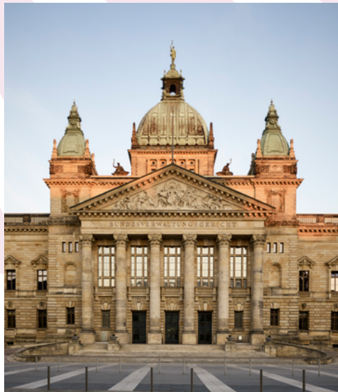
Bundesverwaltungsgericht in Leipzig

E-Mail info@forum-recht-foerdereverein.de Web www.forum-recht-foerdereverein.de