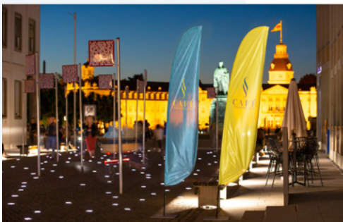
Platz der Grundrechte in Karlsruhe

Die Idee für ein Forum Recht wurde 2015 von Vertreterinnen und Vertretern aus Justiz, Wissenschaft, Wirtschaft, Medien und Gesellschaft aus der Taufe gehoben, um ein offenes Forum für unsere Freiheit und Demokratie zu schaffen. Im Forum Recht sollen alle Menschen zusammenkommen können, um über Recht, Gerechtigkeit und ihre Erfahrungen mit dem Rechtsstaat zu diskutieren – egal, ob vor Ort oder in digitalen Formaten. 2018 wurde mit der Gründung des Fördervereins FORUM RECHT e. V. aus der Idee eines Forums Recht erstmals Wirklichkeit. Heute unterstützen wir als Förderverein die im Jahr 2019 vom Deutschen Bundestag per Gesetz beschlossene Stiftung Forum Recht ehrenamtlich dabei, ein partizipativer Ausstellungs-, Veranstaltungs- und Bildungsort in Karlsruhe und Leipzig zu werden. Hierbei ist uns als Förderverein wichtig, Brücken in die Gesellschaft zu bauen, da es neben den staatlichen Organisationen vor allem die Menschen sind, die unseren Rechtsstaat täglich leben und erleben.